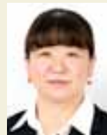
パラリンピック水泳 東京オリンピック・ パラリンピック競技大会 組織委員会理事 成田 真由美

スポーツ医学検定で故障をする前に正しい知識を得ることによって、未然にケガを防ぐきっかけにもつながります。自分の身体のことを知ってより長くスポーツを継続できることを願っています。