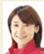
マラソンランナー スポーツコメンテーター 谷川 真理

スポーツ医学検定は「選手の安全」を継続・進化させるための柱となるでしょう。ぜひ、スポーツファミリーを広げていきましょう。