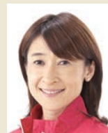
マラソンランナー スポーツコメンテーター 谷川 真理

スポーツのメディカルに関わる人は、裏方でアスリートを支え、スポーツに貢献したいと考えている人です。日々、進歩するスポーツ医学の知識の整理に役立ててください。また、将来スポーツのメディカルに関わる仕事を目指す人は、勉強のきっかけにしてください。